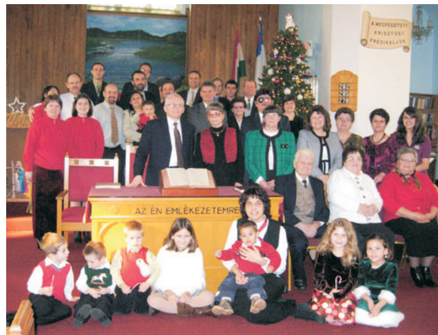
Karácsony napján, a délelőtti istentisztelet után, a karácsonyfa körül.

Taníts minket úgy számlálni napjainkat, hogy bölcs szívhez jussunk! Zsolt 90,12