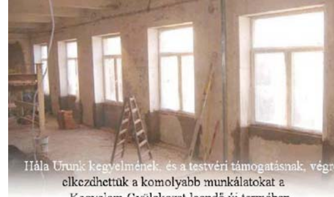
Hála Urunk kegyelmének, és a testvéri támogatásnak, végre elkezdhetjük a komolyabb munkálatokat a Kegyelem Gyülekezet leendő új termében