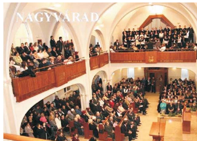
A nemrégiben szépen felújított és kibővített belvárosi imaház épülete