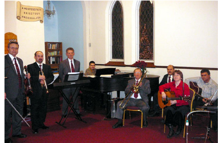
Az adventi zenei ünnepélyen a kórus mellett a zenekar is szolgált.

Monda pedig néki valaki: Uram, avagy kevesen vannak-é akik üdvözülnek? Ő pedig monda nékik: Igyekeztek bemenni a szoros kapun: mert sokan, mondom néktek, igyekeznek bemenni és nem mehetnek. Lukács 13, 23