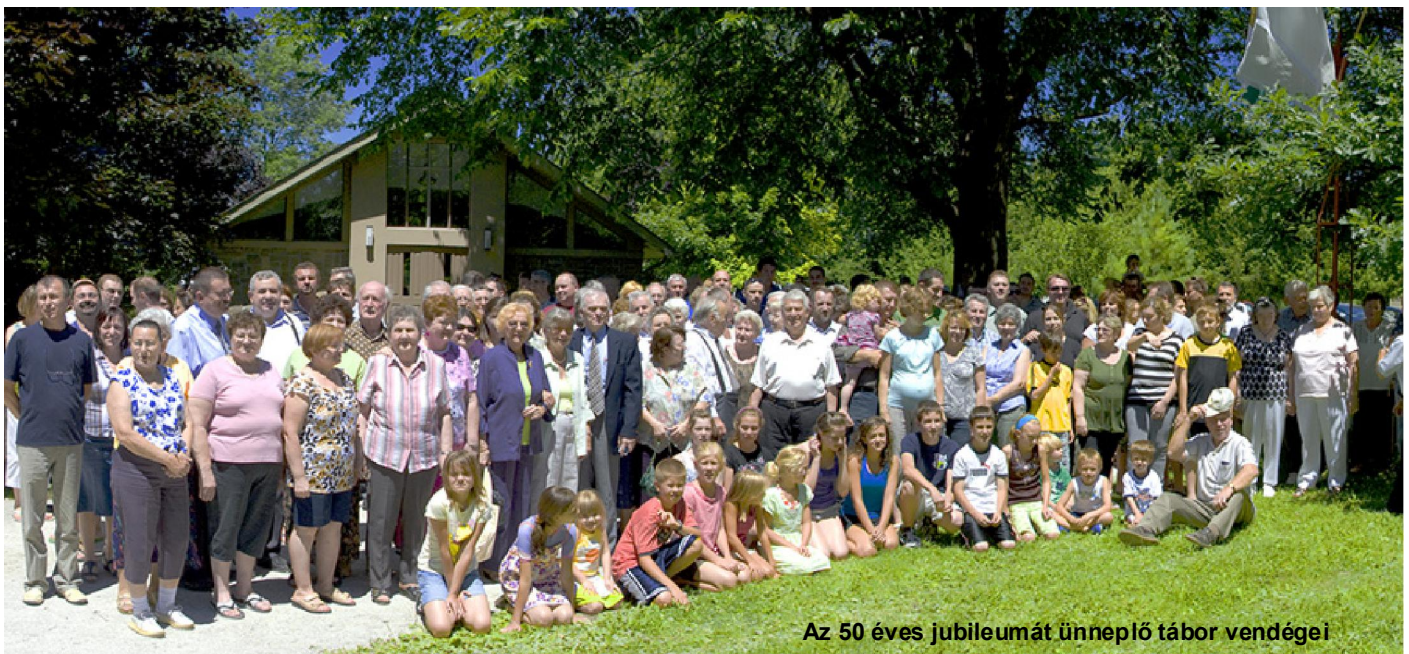
Az 50 éves jubileumát ünneplő tábor vendégei

103 és 50. Van mire emlékezni! Hasznos, ha legalább két dolgot újra meg újra, most is a felszínre hozunk. Az egyik az, hogy milyen nagy az Úr, milyen nagy a mi Urunk. Ő cselekedett, Ő az, aki