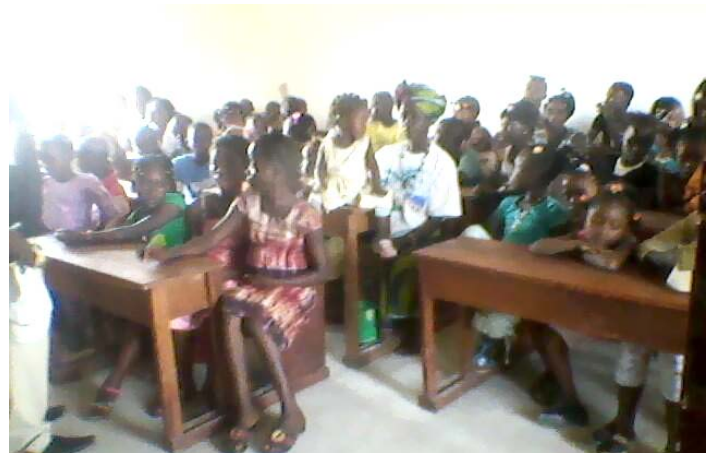
A BTS diploma osztó ünnepélyén, Kamilla és a tanulók. Gyermek karácsony az új iskolánkban.

a végzős hallgatókkal állok, még az eredeti, a többi részt újjá kellett építeni a polgárháború után. Az elmúlt 200 évben több misszionárius és missziós társaság, egymástól szinte függetlenül plántált baptista gyülekezeteket, főként a fővárosban, Freetownban , és számos pünkösdista jellegű gyülekezet is csatlakozott a baptistákhoz.