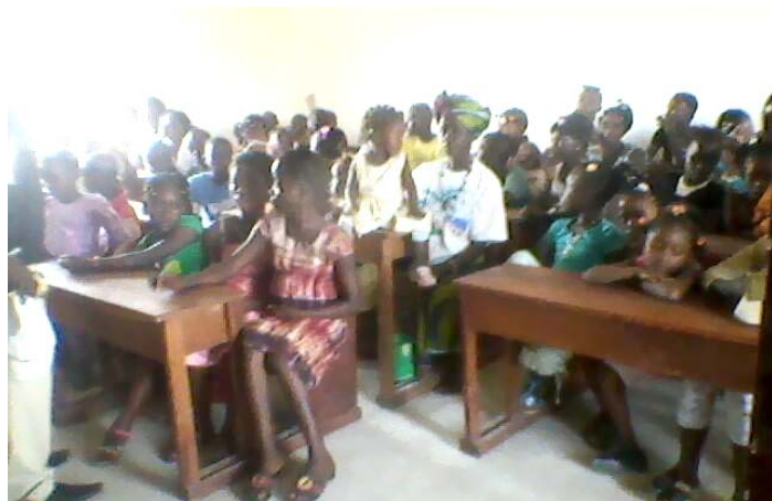
A BTS diploma osztó ünnepélyén, Kamilla és a tanulók. Gyermek karácsony az új iskolánkban.

a végzős hallgatókkal állok, még az eredeti, a többi részt újjá kellett építeni a polgárháború után. Az elmúlt 200 évben több misszionárius és missziós társaság, egymástól szinte függetlenül plántált baptista gyülekezeteket, főként a fővárosban, Freetownban , és számos pünkösdista jellegű gyülekezet is csatlakozott a baptistákhoz.