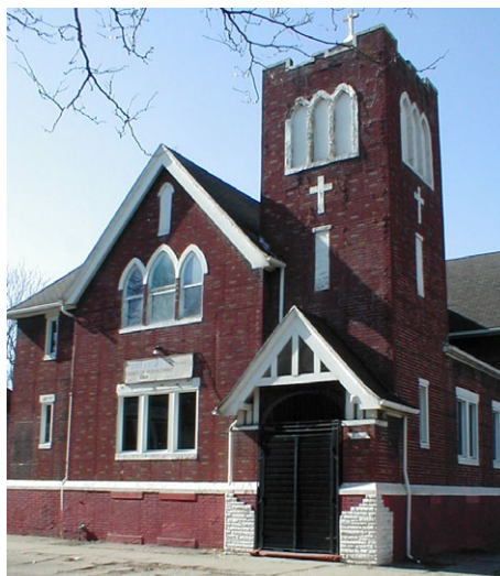
A Vanderbilt utcai egykori imaházunk még most is templomként működik.

1913-ban saját imaházat építettek a detroiti magyar baptisták – úgy olvastam, hogy ez volt az első saját építésű magyar baptista templom a kontinensen. A Detroit magyar lakta városrészében, Delray-ben , a Thaddeus utcában épült tágas, bástya-tornyos imaházat már a 90-es években sem találtuk meg – leégett, vagy lebontották.