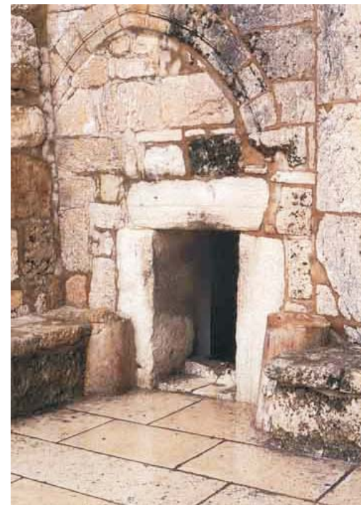
Az "alázat kapuja" Betlehemben

Áldott karácsonyi ünnepeket kíván a gyülekezet minden tagjának, látogatóinknak, barátainknak a lelkipásztor: