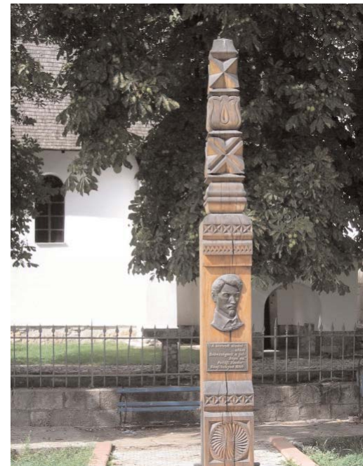
Petőfi-kopjafa a bánffyahunyadi református templom előtt