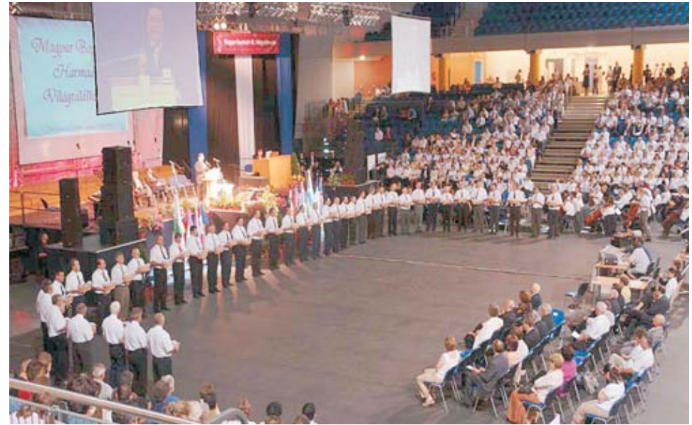
Úrvacsora a Főnix Csarnokban. 2006. aug 6. 5000+ úrvacsorázó, 50 úrvacsora osztó.