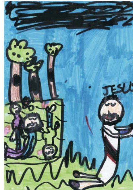
A szerda esti gyermekrajzok közül: Az Úr Jézus imádkozik a Gecsemáné kertben.

A héten ezeket az igéket válogattuk ki az imádságosok közül: Kiméne a hegyre imádkozni, és az éjszakát az Istenhez való imádkozásban tölté el. Lk 6:12