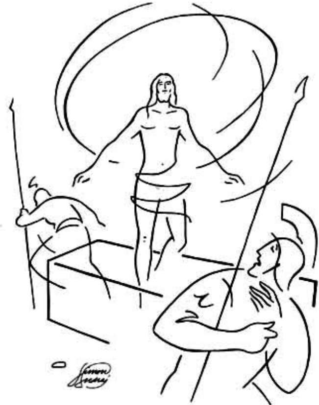
grafika: Simon András

The Great Commission 16Then the eleven disciples went to Galilee, to the mountain where Jesus had told them to go. 17When they saw him, they worshiped him; but some doubted. 18Then Jesus came to them and said, "All authority in heaven and on earth has been given to me. 19Therefore go and make disciples of all nations, baptizing them in the name of the Father and of the Son and of the Holy Spirit, 20and teaching them to obey everything I have commanded you. And surely I am with you always, to the very end of the age."