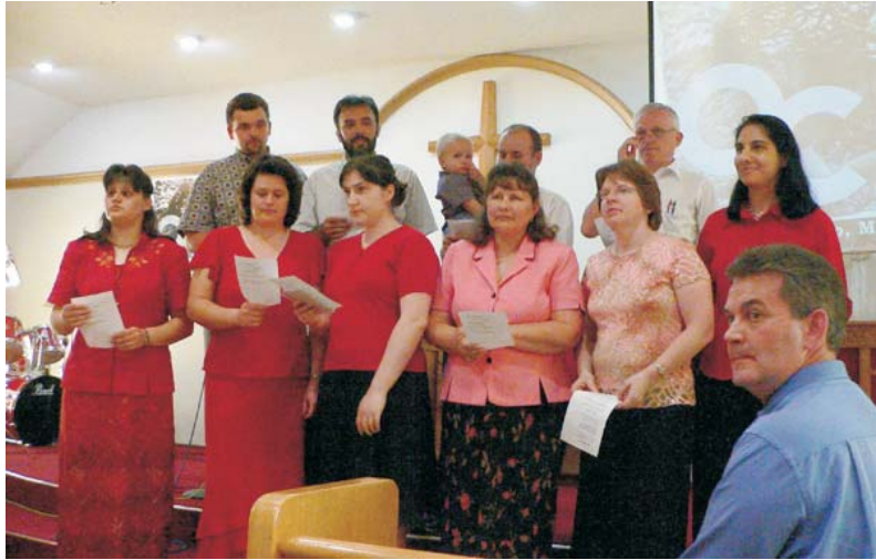
Chicagóban, a kíséretre várva.