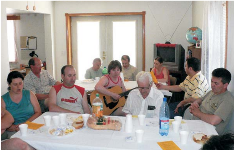
Pap Lajoséknál, a church pikniken - a jelenlevők 1/3-a.