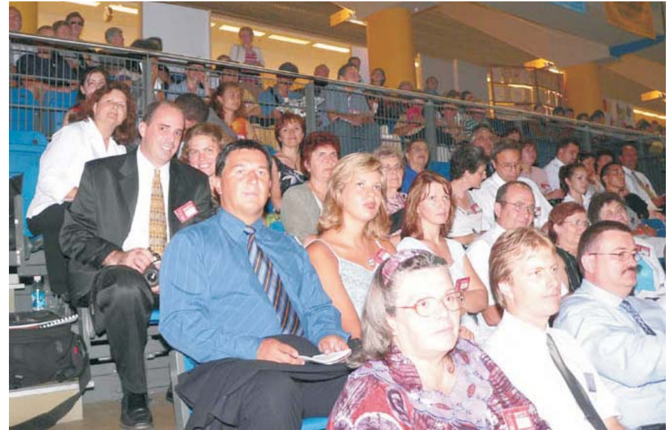
Az amerikai csoport egy része a debreceni Főnix Csarnokban, péntek este.