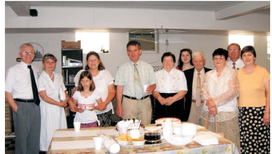
Für Anikót köszöntöttük születésnapja alkalmából a múlt vasárnap.

Hogyha hallgatsz az Úrnak, a te Istenednek szavára, megtartván az Ő parancsolatait és rendeléseit, amelyek megvannak írva e törvénykönyvben, és ha teljes szivedből és teljes lelkedből megtérsz az Úrhoz, a te Istenedhez. Mert e parancsolat, a melyet én e mai napon parancsolok néked, nem megfoghatatlan előtted; sem távol nincs tőled. Nem a mennyben van, hogy azt mondanád: Kicsoda hág fel érettünk a mennybe, hogy elhozza azt nekünk, és hallassa azt velünk, hogy teljesítsük azt? Sem a tengeren túl nincsen az, hogy azt mondanád: Kicsoda megy át érettünk a tengeren, hogy elhozza azt nekünk és hallassa azt velünk hogy teljesítsük azt? Sőt felette közel van hozzád ez íge; a te szádban és szívedben van, hogy teljesítsed azt. (5 Móz 30:10-14)