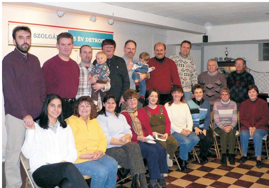
Házaskör - szombat esti felvétel.

Legyen minden ember gyors a hallásra, késedelmes a szólásra, késedelmes a haragra. (Jak 1:19) A nap le ne menjen a haragotokon. (Ef 4:16)