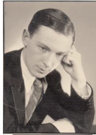
Dsida Jenő 1907-1938

Kész a világ, Feszült ünnepi várás Tereng felette. Halotti csend. Csak néha néha Sóhajt az Isten Lelke. Kimérve minden pálya Megtöltve minden lélek-lámpa, Ahol csak úr a lét... De jaj, sötét van, Mélységes, iszonyú sötét! A zordon tömeg-árnyék Némán zokogva kering útjain, S csak egyet tud és egyet érez... Most váratlanul vágyón megvonaglik És felzúg Istenéhez: Betelt az idő! Sugarat, fényt, színt adj nekünk, Mert epedünk! Fényesség nélkül oly sivár az élet! Nagy alkotónk, oh mondd ki szent ígédet Legyen világosság!... És ismétlik mindig erősebben A felviharzott étheren keresztül És felharsan az eget harsonája S a végtelennek zsolozsmája zendül Zsibongva, zsongva... És nagy szavát az Úr - kimondja!