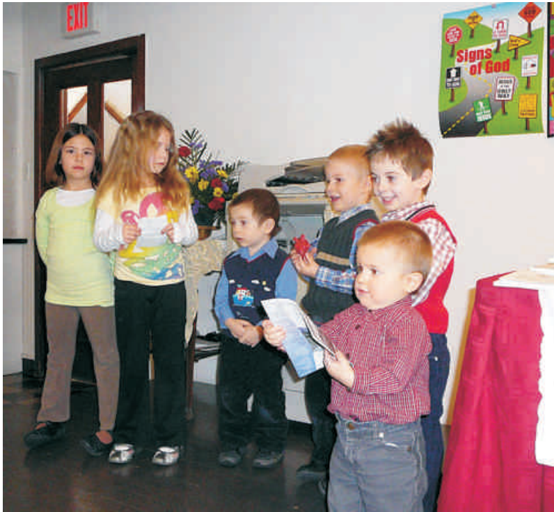
A gyerekek szolgálnak a vasárnapi iskola után.