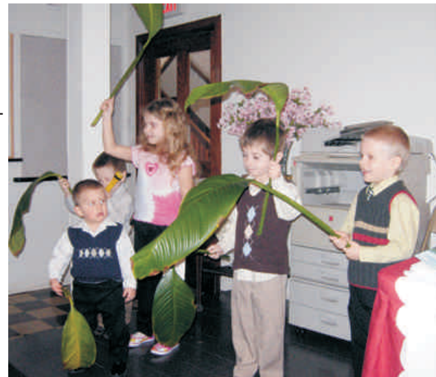
Virágvasárnapi pálmát lengető gyerekek

Holnap, az ima-hétfőn (húsvét másnapja) a lelkipásztor itt lesz az imaházban. Ha valaki csatlakozni akar hozzá az imádságban, bármikor megteheti (10-1-ig és 3-8-ig).