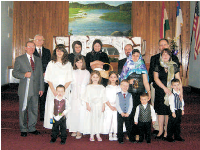
A húsvéti történetet előadó csoport az üres sír előtt.