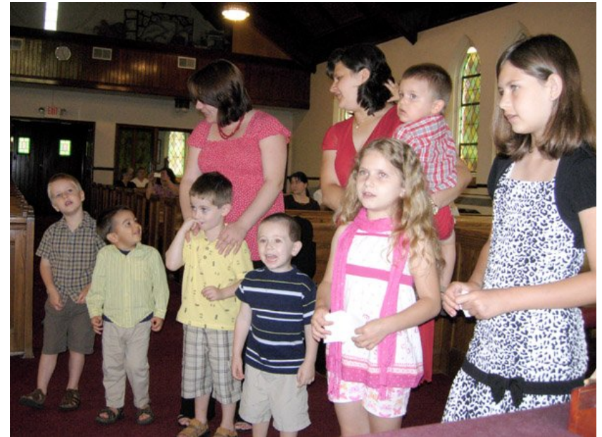
A gyermekek énekel és versekkel köszöntik az édesapákat.

Igaz beszéd ez és teljes elfogadásra méltó, hogy Krisztus Jézus azért jött e világra, hogy megtartsa a bűnösöket, akik közül első vagyok én. 1 Tim 1,15.